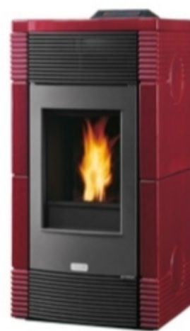
Finitura Rosso Bordeaux